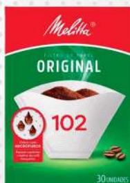
FILTRO DE PAPEL 102 1X30 CX MELITA COD: 4206