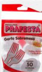
GARFO SOBREMESA CRISTAL 1X50 PT PRAFESTA COD: 1375