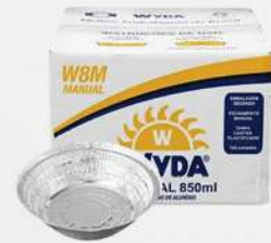
MARMITEX NR-08 MANUAL 1X100 CX WYDA COD: 1050