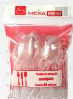
COLHER REFEICAO CRISTAL MASTER 1X50 PT MEXA BEM COD: 7699