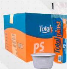
POTE DESC.200ML TR. 20X50 PS PT TOTALPLAST COD: 7618