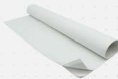
PAPEL MANTEIGA 50X70CM 1X1 UN EMBALABEM COD: 4652