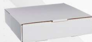
EMBALAGEM P/ BOLOS N.10 1X1 UN TAMAROZZI COD: 7181