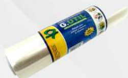
FILME PVC 28X300MT UN GUARUFILME COD: 5319