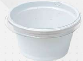
EMB.PLAST. G-695 30ML P/ MOLHOS 1X700 CX GALVANOTEK COD: 7221