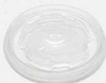
TAMPA P/ COPO TERMICO 180ML 1X100 PT MEIWA COD: 5846