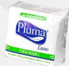
GUARDANAPO DE PAPEL 30X31 LUXO 30X100 CX PLUMA COD: 5223