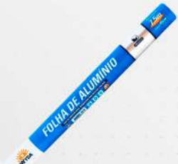
PAPEL ALUMINIO 45CM 1X7,5MT RL WYDA COD: 1100