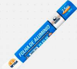
PAPEL ALUMINIO 30CM 1X7,5MT RL WYDA COD: 1098