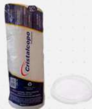
TAMPA T-700 P/COPO 700ML C/FURO 20X30 CX CRISTAL COD: 6610