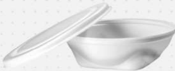
EMB. ISOPOR RED.C/TP PT-104 1100ML 1X100 FD COPOBRAS COD: 7746