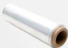
FILME PE STRETCH 50CM 4KG C/ TUBETE UN GUARUFILME COD: 7603