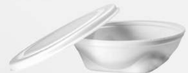
EMB. ISOPOR RED.C/TP PT-102 750ML 1X100 FD COPOBRAS COD: 7607