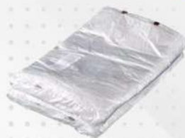
SACO PLAST.BLOC. 20X30CM 1X1000 PT PLASTPEL COD: 4508