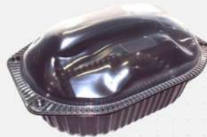
EMB.PLAST. G-100 P/ FRANGO 1X100 CX GALVANOTEK COD: 7608