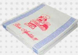
ENVELOPE P/PIZZA N-35 MONO. 1X250 FD PLASTPEL COD: 1793