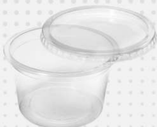
POTE REDONDO PP PT PRAFESTA / PT RIOPLASTIC