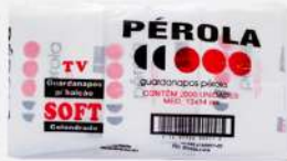
GUARDANAPO TV 13X14 BRANCO 1X2000 PT PEROLA COD: 6914