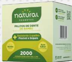
PALITO P/DENTE BAMBU SACHE 1X2000 CX NATURAL COD: 4924