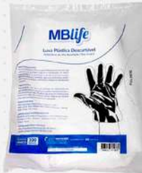
LUVA DESCARTAVEL PLASTICA 1X100 PT MEDIX COD: 7525