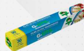
FILME PVC 28X30MT UN GUARUFILME COD: 1094