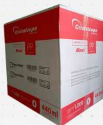
COPO DESC.400ML PPT-440 20X50 PP CX CRISTAL COD: 7255