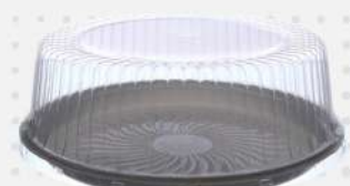
EMB.PLAST.TRANSP. G-56M 1X1 UN GALVANOTEK COD: 1023