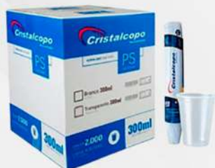
COPO DESC.300ML TRANSP. 20X100 PS CX CRISTAL COD: 6017