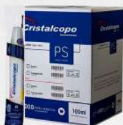
TAMPA TST-100 P/ POTE 100ML 20X100 CX CRISTAL COD: 6029