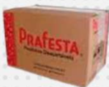
COLHER SOBREMESA CRISTAL 1X1000 CX PRAFESTA COD: 1355