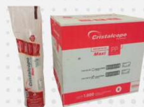
COPO DESC.500ML PPT-550 20X50 PP CX CRISTAL COD: 7256