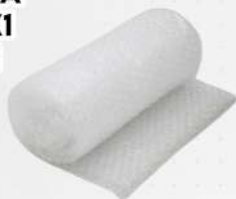
PLASTICO BOLHA BOBINA 100MT BO PLAST BOLHA COD: 5428