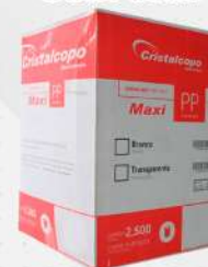
COPO DESC.300ML PPT-330 20X50 PP CX CRISTAL COD: 6289