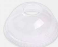
TAMPA BOLHA P/COPO 400/500ML S/FURO G-676 PT GALVANOTEK COD: 7825