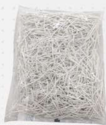
FECHO PLASTICO 8CM 1X1KG PT TAMAROZZI COD: 4294