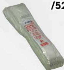
SACO PLAST.VIR. 04X23X0,03 A.D.1X1000 PT ARRUDAPLAST COD: 4869

COD: 6687/4536/4519/4705/4522/2303/4527/4529 /5231/5075/2707/3025/2315/4772/7112/2317/4535/4773