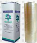
FILME PVC 38X700MT UN GUARUFILME COD: 7652