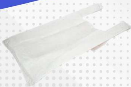
SACOLA PLAST. BRANCAS PT PLASTPEL