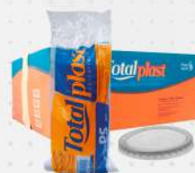
TAMPA TR. P/POTE 200/250ML 20X50 CX TOTALPLAST COD: 7619