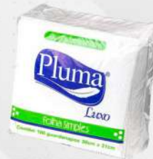
GUARDANAPO DE PAPEL 20X21 LUXO 50X100 CX PLUMA COD: 5221