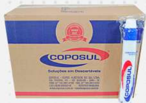
COPO DESC.050ML BCO. 50X100 PS CX COPOSUL COD: 6239