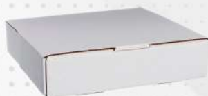
EMBALAGEM P/ BOLOS N.09 1X1 UN TAMAROZZI COD: 7180