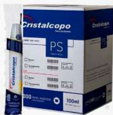
POTE DESC.100ML TR. 20X100 PS CX CRISTAL COD: 6023