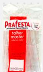
FACA REFEICAO CRISTAL MASTER 1X50 PT PRAFESTA COD: 4385