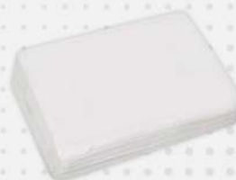
TOALHA AMERICANA BCA LISA 1X500 PT PLUMA COD: 5374