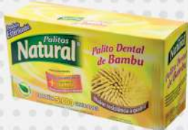
PALITO P/DENTE BAMBU 1X5000 CX NATURAL COD: 5217