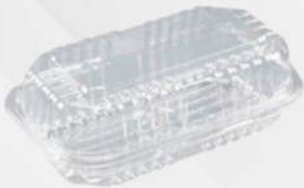
EMB.PLAST.TRANSP. G-10 1X100 CX GALVANOTEK COD: 7680