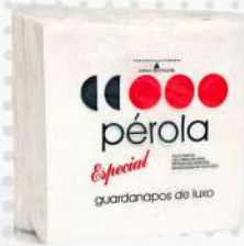
GUARDANAPO DE PAPEL 19, 5X20 50X100 CX PEROLA COD: 1885