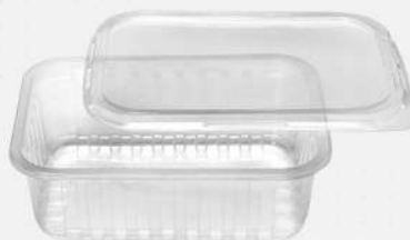
POTE RETANGULAR PP PT PRAFESTA