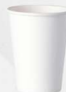
COPO DE PAPEL 240ML BRANCO 1X25 PT CRISTAL COD: 7904