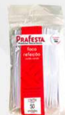
FACA REFEICAO CRISTAL 1X50 PT PRAFESTA COD: 1499