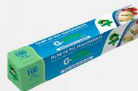
FILME PVC 28X100MT UN GUARUFILME COD: 7600