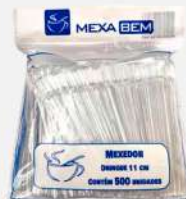
MEXEDOR DRINQUE CR. 11CM 1X500 PT MEXA BEM COD: 7694