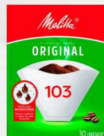
FILTRO DE PAPEL 103 1X30 CX MELITA COD: 5055