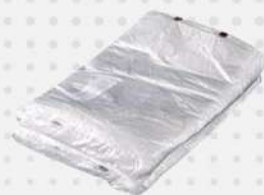
SACO PLAST.BLOC. 30X40CM 1X1000 PT PLASTPEL COD: 4512