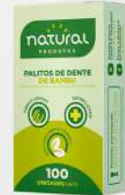
PALITO P/DENTE BAMBU 1X100 CX NATURAL COD: 4832