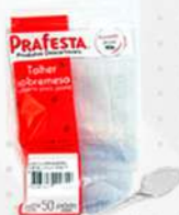
COLHER SOBREMESA CRISTAL 1X50 PT PRAFESTA COD: 1525