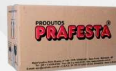
GARFO SOBREMESA CRISTAL 1X1000 CX PRAFESTA COD: 1373