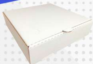
EMBALAGEM P/ SALGADOS N.30 1X1 UN TAMAROZZI COD: 7179