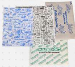
PAPEL ACOPLADO PLAST. MONO. 1X400 CX PLASTPEL COD: 4442