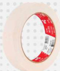
FITA CREPE 24MMX50MT 1X1 RL NOVE54 COD: 7780