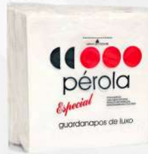
GUARDANAPO DE PAPEL 29, 5X30 30X100 CX PEROLA COD: 2767