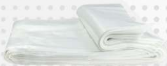
SACO PLAST.ALT.DENS. 50X80CM C.BAS.1X5KG PT PLASTPEL COD: 4507