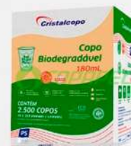
COPO DESC.180ML TR. 25X100 BIODEGRADAVEL CX CRISTAL COD: 6529