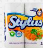
PAPEL TOALHA PARA COZINHA 12X2 FD STYLUS COD: 2990