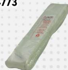
SACO PLAST.VIR. 06X25X0,03CM 1X1000 PT ARRUDAPLAST COD: 6998