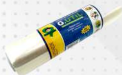
FILME PVC 38X300MT UN GUARUFILME COD: 5072