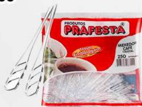
MEXEDOR P/CAFE CR. PEQUENO 1X250 PT PRAFESTA COD: 4426