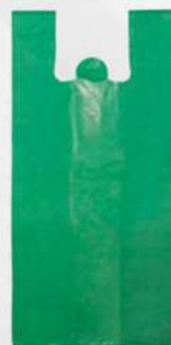
SACOLA PLAST COLORIDA PT LS EMBALAG.

90X100CM 1X4KG / 60X80 COLOR. 5KG 50X60 COLOR. 5KG / 40X50 COLOR. 5KG 30X45 COLOR. 5KG