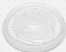
TAMPA P/ COPO TERMICO 100ML 1X100 PT MEIWA COD: 5329