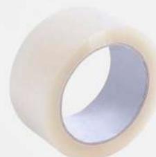
FITA PVC 48MMX100MT TR. 1X RL KORETECH COD: 6828