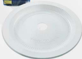
PRATO BCO REFEICAO 21CM 50X10 CX CRISTAL COD: 7177