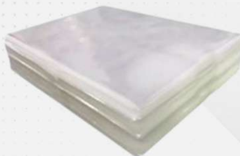
SACO PLAST.PP PT EMBAL.IBITINGA