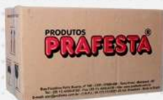
GARFO REFEICAO CRISTAL 1X1000 CX PRAFESTA COD: 1502