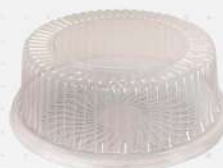
EMB.PLAST.TRANSP. G-32M 1X100 CX GALVANOTEK COD: 6198