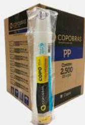
COPO DESC.180ML TRANSP. 25X100 PP ABNT CX COPOBRAS COD: 4050