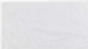
SACO PLAST.LEIT.P/HAMB. 25X18 1X1KG PT ZPP COD: 5851