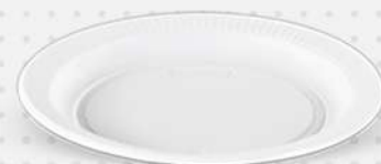
PRATO BCO SOBREM. 15CM 100X10 CX CRISTAL COD: 7176