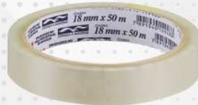
DUREX TRANSP. 18MMX50MT 1X1 UN COREPLAST COD: 5937