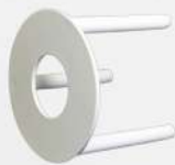
MESINHA P/ PIZZA TRANSPIZZA 1X500 PT MG COD: 6088