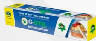
FILME PVC 38X300MT TRILHO UN GUARUFILME COD: 7602