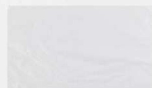
SACO PLAST.LEIT.P/HOT DOG 20X13 1X1KG PT ZPP COD: 2751