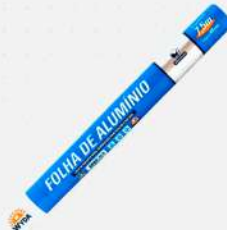
PAPEL ALUMINIO 45CM 1X65MT RL WYDA COD: 4433