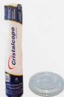
TAMPA T-300 P/COPO 300ML C/FURO 20X100 CX CRISTAL COD: 6306