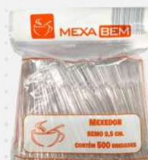
MEXEDOR P/CAFE CR. REMO 9,5CM 1X500 PT MEXA BEM COD: 7693