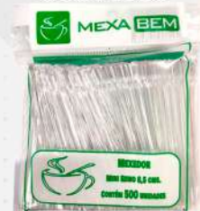
MEXEDOR P/CAFE CR. MINI REMO 8,5CM 1X500 PT MEXA BEM COD: 7692