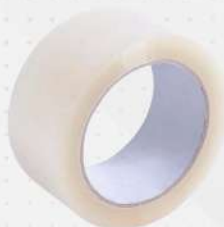
FITA PVC 45MMX45MT TR. 1X1 RL COREPLAST COD: 2674