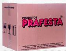
COLHER REFEICAO CRISTAL 1X1000 CX PRAFESTA COD: 1350