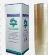
FILME PVC 38CMX1000MT UN GUARUFILME COD: 6535