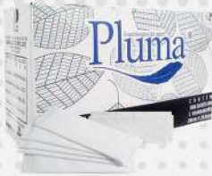
GUARDANAPO DE PAPEL 28X20, 5 SACHE 1X1000 CX PLUMA COD: 7678