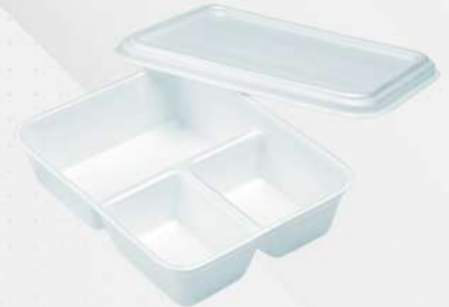
EMB. ISOPOR C/TP MO-90F 3DIV.900ML 1X100 CX MEIWA COD: 5570