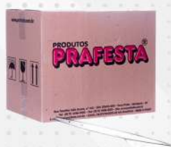
FACA REFEICAO CRISTAL 1X1000 CX PRAFESTA COD: 1498