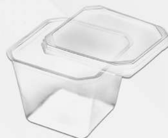
POTE QUADRADO PP PT PRAFESTA