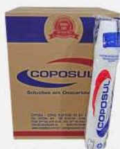
COPO DESC.180ML TRANSP. 25X100 PS CX COPOSUL COD: 6251