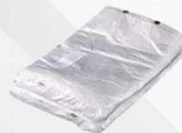
SACO PLAST.BLOC. 25X35CM 1X1000 PT PLASTPEL COD: 4511