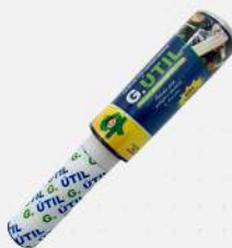
FILME PVC 12CMX100MT C/ CABO G-UTIL UN GUARUFILME COD: 7605