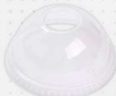
TAMPA BOLHA P/COPO 400/500ML C/FURO G-676 PT GALVANOTEK COD: 7824